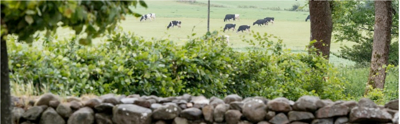
Samarbejde mellem Grundtvigsk Forum, TPC og Lolland-Falster Stift.